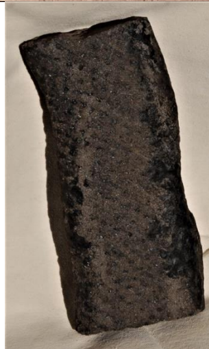
Kalamites – kmen stromu z ostravského karbonu v nadložním pískovci